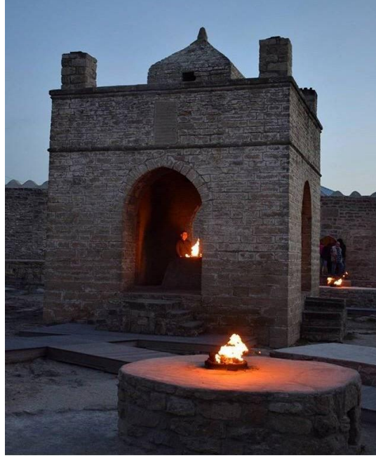
Resim 1. Bakü Surahanı Ateşgahı.