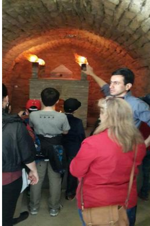
Resim 2. Turistlerin Ateşgahı Ziyareti.